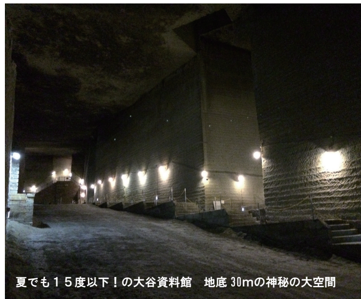
夏でも15度以下！の大谷資料館 地底30mの神秘の大空間